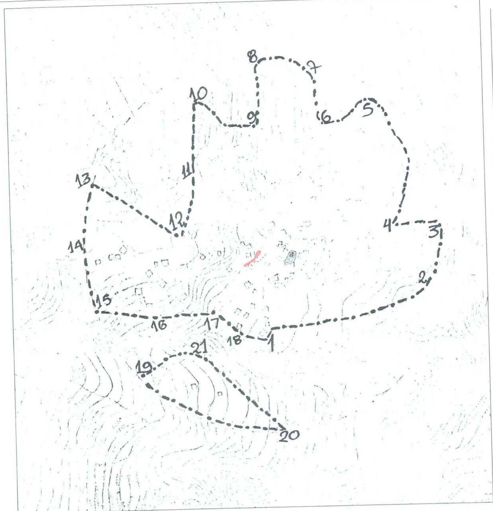
ΑΠΟΣΠΑΣΜΑ ΑΠΟ ΕΓΚΕΚΡΙΜΕΝΟ ΣΧΕΔΙΟ ΟΙΚΙΣΜΟΥ ΑΝΘΟΦΥΤΟΥ

Διόγκω Μηνιαίο Οι επιβλεπόμενοι οφθαλμοί αναμένονται επ' επόμενης ώρας Κ. Σωφίας ΚΕΣΤΟΣ ΓΕΩΡΓΙΟΣ ΑΡΧΙΤΕΚΤΩΝ ΜΗΧΑΝΙΚΟΣ Π.Ε.